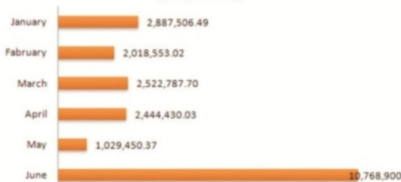
Bi-annual Procurement Progress (January-June 2015)

سرانجام ڏيڻ لاءِ مدد ملي آهي. گڏوگڏ هن شعبي جو قيام عالمي ادارن جي عين تقاضائن موجب آهي. هي شعبو سرسو اداري ۾ ڪرنگهي واري هڏي جهڙي حيثيت رکي ٿو. سندس ڪارڪردگي جي ڪري پراجيڪٽ ۽ ضلعي عملي کي سهوليت ميسر ٿي رهي آهي.